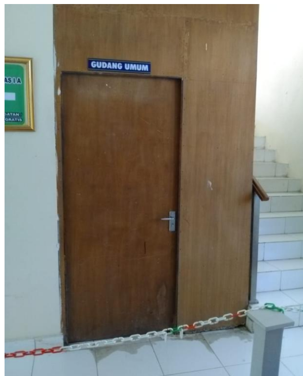
Gudang menjadi ruang kesehatan