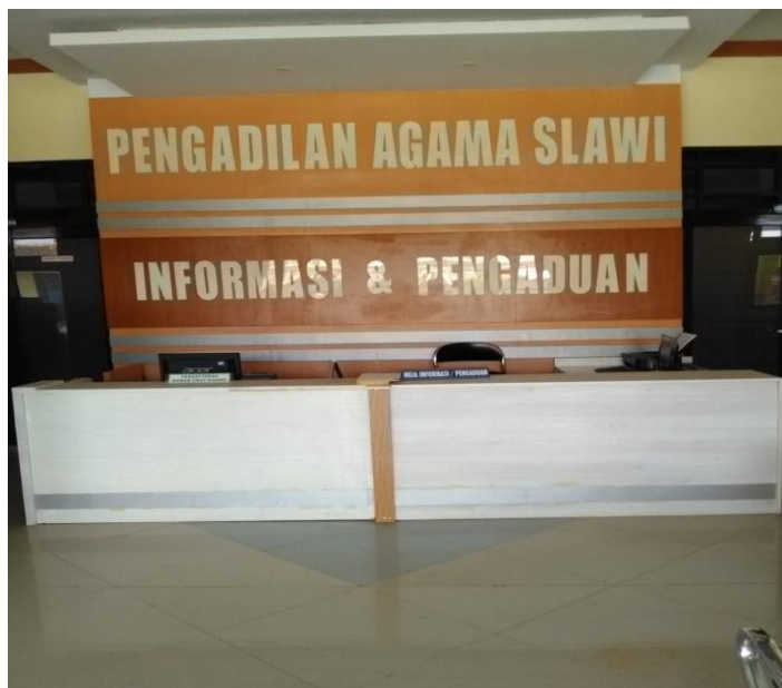
Bedrov keadaan saat ini.