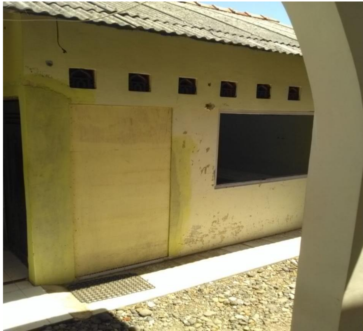
Ruang Eks Koperasi menjadi Ruang Pos Bakum