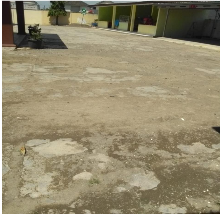
Keadaan halaman sebelah timur/berdebu