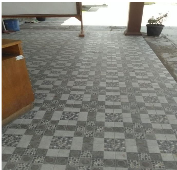
Teras halaman timur/pelayanan