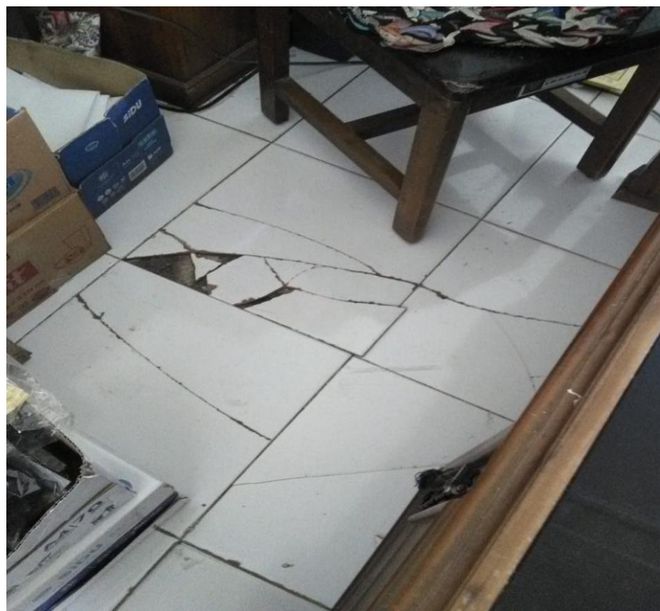
Ruang Petugas Register