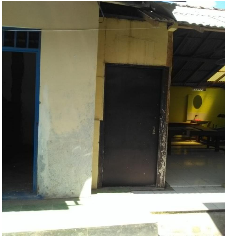
Ruang genset II akan menjadi gudang

5. Perbaiki sice ruang lobi, agar masyarakat / tamu merasa nyaman.