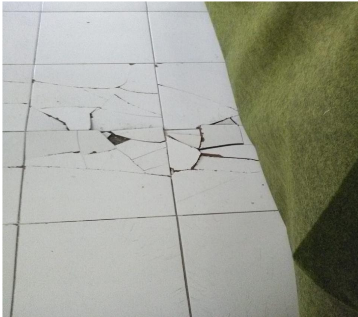
Ruang sidang utama