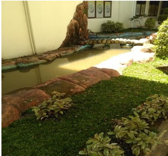
Kolam mengalami kebocoran, air mengalami kesusutan