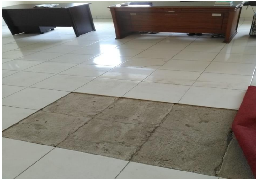
Ruang Hakim II Lantai II