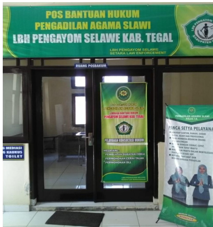
Ruang Pos Bakum akan di rubah menjadi ruang Pengacara / Advokat